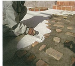
▶ テクノカラーFWの塗り付け