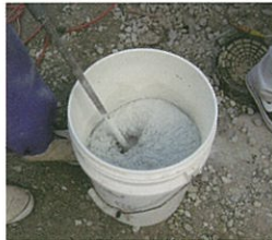
▶ テクノカラーFWの練り混ぜ (混和液3.6~4.0kgの) 範囲で調整