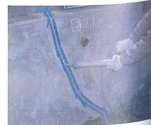
ひび割れへの施工状況