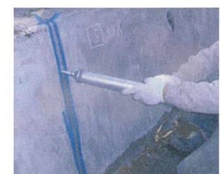
目地への施工状況

開水路の目地・ひび割れ補修に使用できる、耐候性に優れたコーキング工法。マニュアルの目地充填工法および弾性シーリング材ひび割れ充填工法の品質規格に適合する。